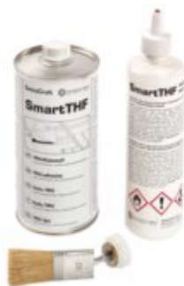
WELD, Flasche + Pinsel