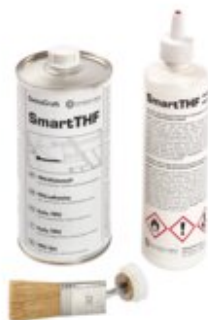
WELD, Flasche + Pinsel